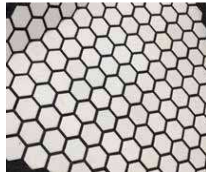
Špárovanie hliníkových doštičiek