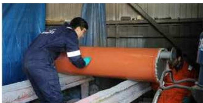
Aplikácia na tesniacu nádobu

Po úplnom vytvrdnutí nová napeňovacia epoxidová technológia umožňuje materiálu Belzona 5871 expandovať až na 3-násobok hrúbky, v akej bol pôvodne aplikovaný, čím sa znižuje počet potrebných vrstiev v porovnaní s konvenčnými náterovými systémami. Rast peny s uzavretými bunkami vytvára izolačnú bariéru, ktorá zabraňuje tepelným stratám, povrchovým popáleninám a korózii pod izoláciou (CUI).