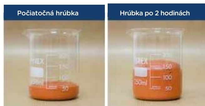
Belzona 5871 - expanzia peny po 2 hodinách

Pre viac informácií, kontaktujte prosím: